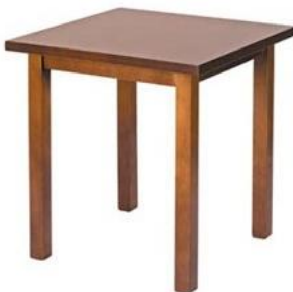
Posible modelo de mesa para el restaurante