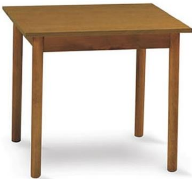
Propuesta de mesas