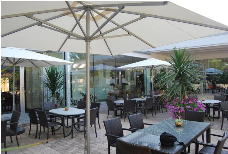
Modelos de mobiliario para la terraza

Baeza, 15 de julio de 2016 La historiadora del arte. Técnica en Patrimonio