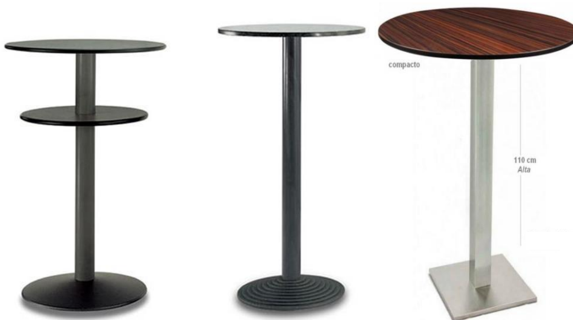
Mesas circulares para zona de taburetes