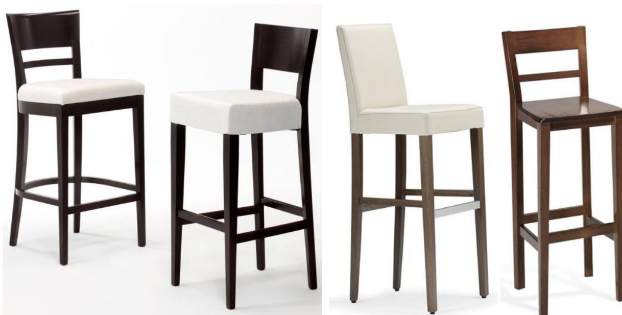
Posibles modelos de taburetes