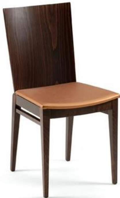
Posibles modelos de sillas