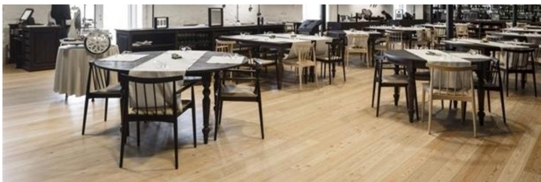
Modelos posibles de sillas